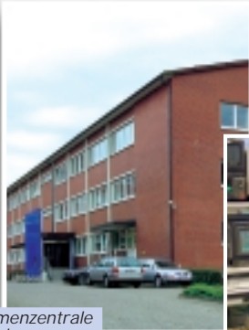
Die Firmenzentrale im Hamburg

Seit ihrer Gründung im Jahr 2000 hat die BPM GmbH ihren Sitz in Hamburg. Die Kompetenz in diesem Markt konnte sich die BPM durch langjährige Zugehörigkeit zum Sony Deutschland Konzern erwerben.