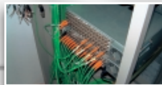
Systemverkabelung einer Kreuzschiene

Im Fokus steht immer Ihr individueller Bedarf , den wir genau analysieren und zielgenau mit einer kostengünstigen Lösung realisieren. Dass wir uns an Standards wie das MedPG halten, ist selbstverständlich.