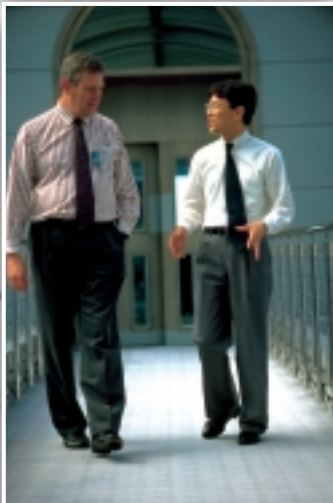
Wir sind für Sie da, wann immer Sie uns brauchen ...

Unsere Spezialisten haben auch für Ihre Fragen die richtige Antwort.