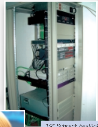
19" Schrank bestückt

Damit wir für Sie die optimale Lösung im Bereich moderner Kommunikationstechniken erreichen, verwenden wir ausschließlich hochwertige Komponenten , die im Dauereinsatz weitestgehend wartungsfrei und langlebig sind: denn schließlich verdienen Sie als professioneller Anwender mit Ihren Anlagen Geld und sind daher insbesondere auf hohe Zuverlässigkeit der Systeme angewiesen.